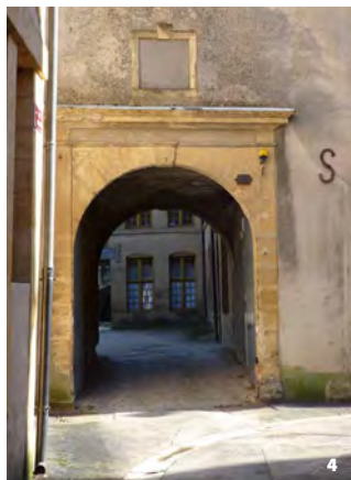
4. Entrée de l'Académie des Exercices

Henri de La Tour d'Auvergne dote la ville de grands édifices publics, civils et religieux. Il aménage également la place d'Armes, renforce les fortifications et met en œuvre un plan d'urbanisme rectiligne, agissant ainsi en prince bâtisseur. Henri de La Tour d'Auvergne a nourri ses enfants de récits de bataille et de l'histoire de son illustre lignée, enflammant leur imagination, et insufflant à Turenne des rêves de gloire et le goût de la carrière des armes.